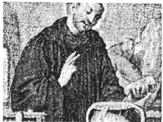
Jeho atributy jsou olejová lampa a skála.

dobrotivý. Papež Řehoř Veliký v roce 593 ve vyprávění o opatu Nonnovi uvedl mimo jiné i tři zázraky, k nimž došlo ještě za panování velmi přísného opata, kdy však na něho byla kladena větší odpovědnost za úkoly, které měla celá komunita vykonat. Zaznamenané zázraky jsou pouze svědectvím, že lze žít podle evangelia velmi důsledně a tak mnohé změnit. S některými tvrdými srdci toto však nepohne. To ale nemá nikoho odradit. Nonnos zemřel jako opat a byl pohřben ve svém klášteře kolem roku 570. Jeho kamenný sarkofág v domě Panny Marie, se stal cílem poutníků zejména s ledvinovým onemocněním.