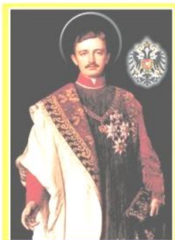
Blahoslavený Karel oroduj za nás

se v roce 1916 stal císařem Rakouska, kam až do října 1918 patřily i země nynější České republiky, a byl korunován jako král Maďarska. Usiloval o spravedlivý a trvalý mír a prosazoval právo a spravedlnost. Po změně státního uspořádání byl v roce 1919 donucen opustit vlast, žil v chudobě a svou nemoc snášel s hlubokou důvěrou v Boha. Když 1. dubna 1922 umíral ve Funchalu na ostrově Madeiře, vzýval jméno Ježíšovo. Papež Jan Pavel II. ho 3. října 2004 prohlásil za blahoslaveného.